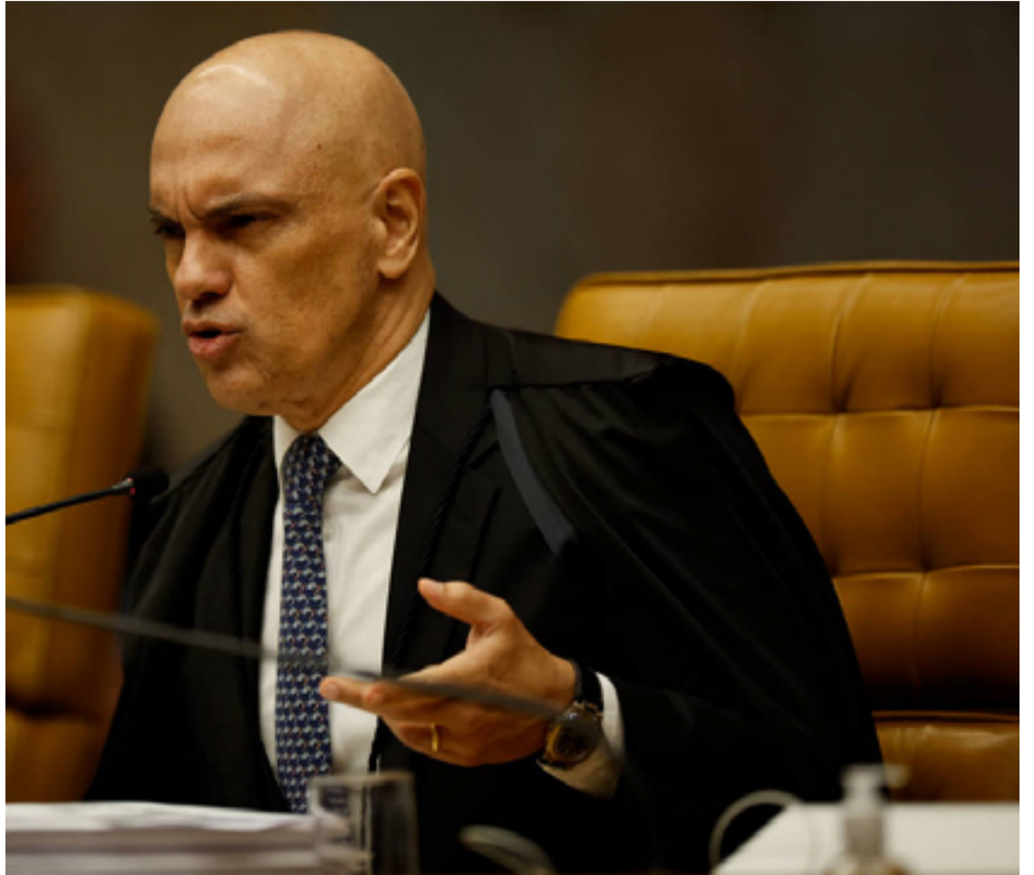
Alexandre de Moraes: decisão polêmica sobre bloqueio no Brasil da rede social X

Moraes justificou a mudança na ordem alegando que o próprio X poderia atender a