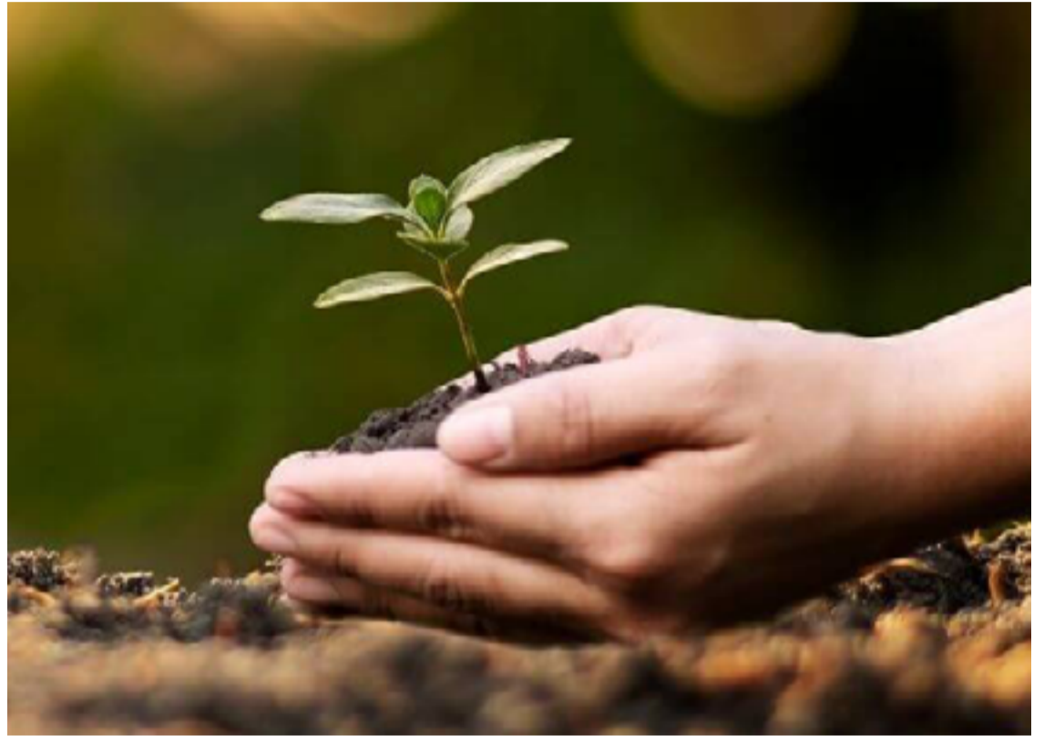
A irregularidade foi detectada após a Promotoria de Justiça solicitar à SEMAD uma vistoria in loco na empresa

Conforme o relatório, a empresa não cumpriu as exigências da licença ambiental, ultrapassando os prazos para regularização. O representante da empresa atribuiu o atraso ao descaso de um profissional contratado, mas informou que já substituiu o prestador de serviço e cumpriu todas as condicionantes que motivaram a lavratura do auto de infração. Foi ainda apresentada uma cópia da ata de audiência de autocomposição realizada em 18 de julho com a SEMAD, na qual foi firmado um acordo para o cumprimento das exigências.