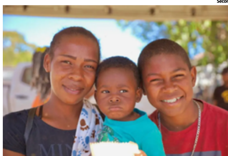
Para fazer parte do Mães de Goiás, a mãe deve manter o CadÚnico atualizado