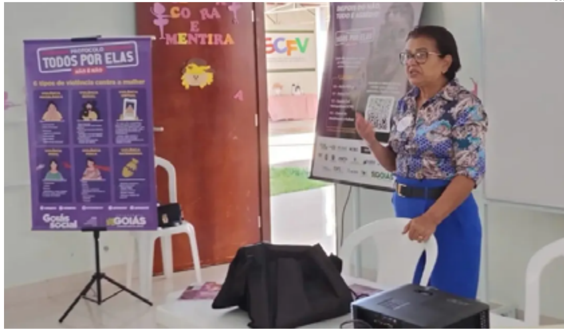
O trabalho conjunto do Goiás Social e parceiros tem refletido nos índices de violência contra a mulher em Goiás

Ao aderirem ao Pacto, os municípios se comprometem a implementar as políticas estabelecidas. Elas incluem: criação do Conselho de Direito da Mulher; instituição do programa do Tribunal de Justiça, que leva informações da lei Maria da Penha para as escolas; e ins-