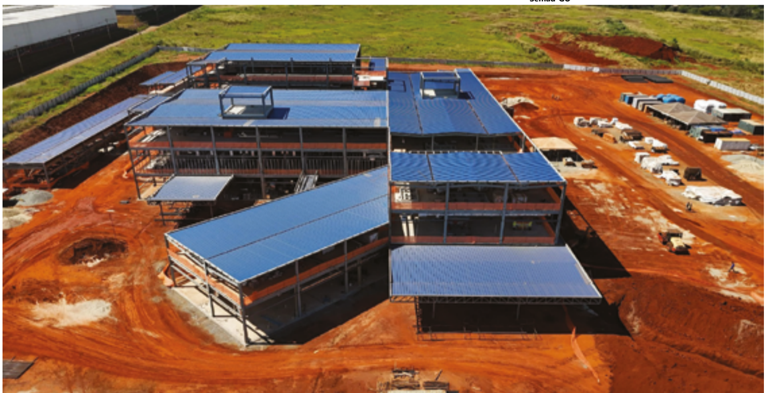
Tribunal de Contas do Estado de Goiás (TCE-GO) arquivou a representação do diretório estadual do PSDB contra o modelo de contratação utilizado pelo Governo de Goiás

O Tribunal de Contas do Estado de Goiás (TCE-GO) arquivou a representação do diretório estadual do PSDB contra o modelo de contratação utilizado pelo Governo de Goiás na construção do Complexo Oncológico de Referência do Estado de Goiás (Cora). O relator, Sebastião Tejota, teve seu voto seguido por quatro conselheiros, encerrando o julgamento na última sexta-feira, 30. Com a decisão, o órgão confirma que não há inconstitucionalidade no modelo escolhido para construção e gestão da unidade. O entendimento do TCE foi reforçado por pareceres do Ministério Público de Contas, do Serviço de Fiscalização de Saúde e da Auditoria do Tribunal, que concluíram pela improcedência da representação por ato de improbidade. Desta forma, o TCE valida a legalidade do ajuste de parceria entre o Estado e a Fundação, conforme a Lei nº 13.019/2014, também conhecida como Marco