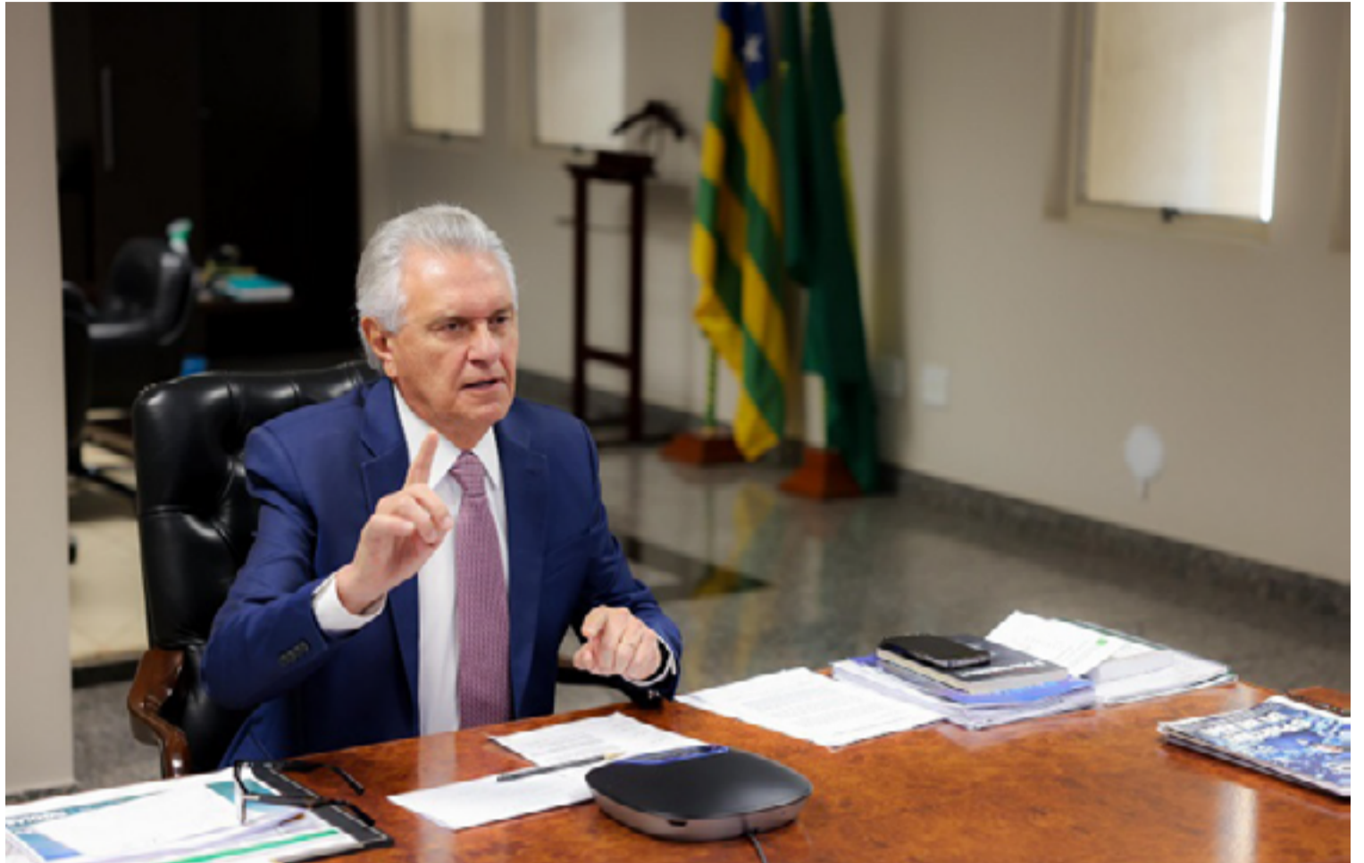
Ronaldo Caiado: Brasil precisa de um novo projeto de gestão, com eficiência e responsabilidade

Caiado voltou a dizer que o seu projeto presidencial não é um desejo pessoal, algo que