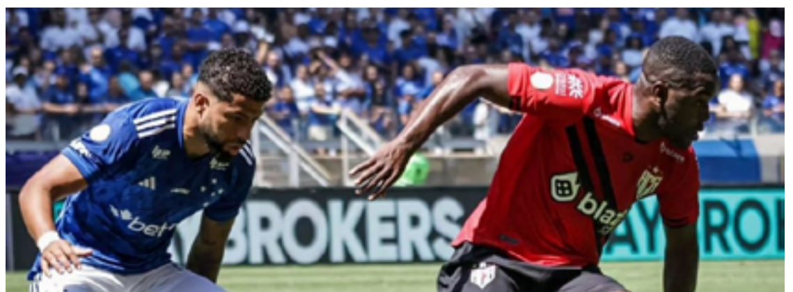
Dragão perdeu de 3 a 1 para Cruzeiro ontem no Mineirão

A próxima rodada terá jogo do Atlético-GO contra o Vitória, em Goiânia, mas longe: só no dia 14. O Cruzeiro pegará o São Paulo, no Mineirão, no dia 15.