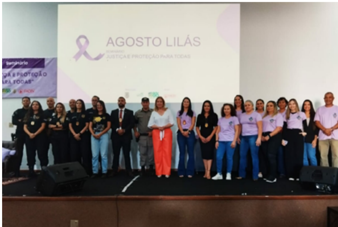
O seminário foi especialmente relevante no contexto do "Agosto Lilás", uma campanha nacional dedicada à conscientização e combate à violência contra a mulher

Com uma carga horária de 12 horas/aula, o seminário ofereceu um espaço de aprendizado intensivo, abordando questões cruciais para o fortalecimento das políticas públicas voltadas para a segurança das mulheres. As discussões foram conduzidas por especialistas da área, que compartilharam suas experiências e conhecimentos sobre os desafios enfrentados na implementação de medidas de proteção e na busca por justiça para todas as mulheres