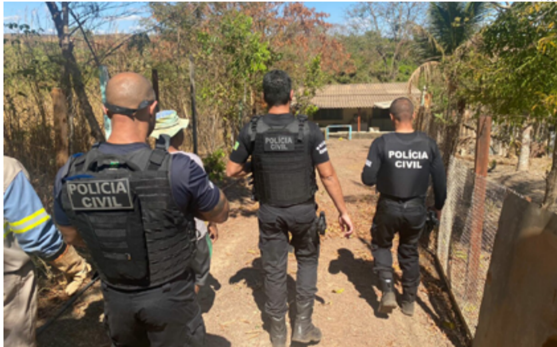
A atuação rápida e eficiente das autoridades foi crucial para evitar que o problema se agravasse e causasse ainda mais danos à comunidade.

Em uma das propriedades, a equipe constatou que a fiação clandestina atravessava uma estrada de terra pública, aumentando consideravelmente o risco de acidentes elétricos