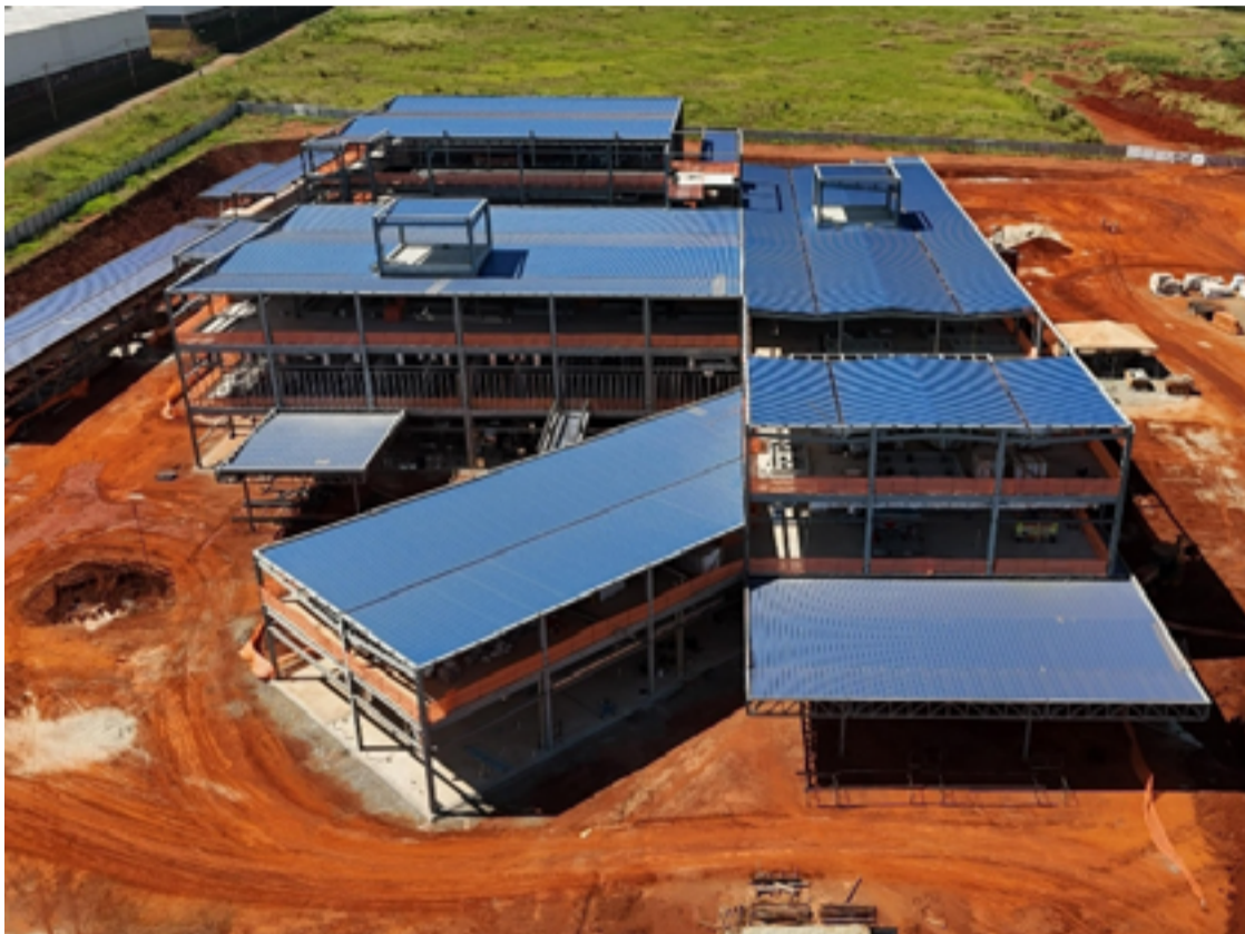
Decisão do TCE derruba representação do PSDB e confirma legalidade no modelo adotado pelo estado para construção e gestão do Cora

Tribunal confirma constitucionalidade do modelo de contratação adotado pelo Governo de Goiás. Complexo oncológico atenderá crianças com câncer