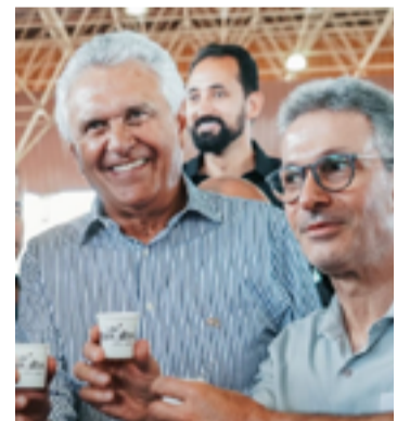
Ronaldo Caiado e Romeu Zema: ausências no ato de 7 de Setembro em SP

Vários deputados federais de direita, como Carla Zambelli (PL-SP), Ricardo Salles (Novo-SP), Marcel Van Hattem (Novo-RS) e Altineu Cortes (PL-RJ) confirmaram presença.